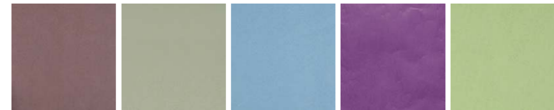
25 - TABACCO 68 - VERDE OLIVA 121 - ACQUAMARINA 195 - MELANZANA 197 - VERDE PISELLO